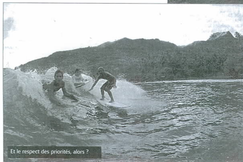
Et le respect des priorités, alors ?

Les stages sont entièrement gratuits pour tous les jeunes, le financement étant assuré par le ministère de la Solidarité, l'Épap, le contrat de ville, l'association Enfants du fenua et les assurances Gan. Après sept années sur l'atoll de Tikehau, les jeunes ont cette fois découvert les vagues marquisiennes sur l'île de Hiva Oa.