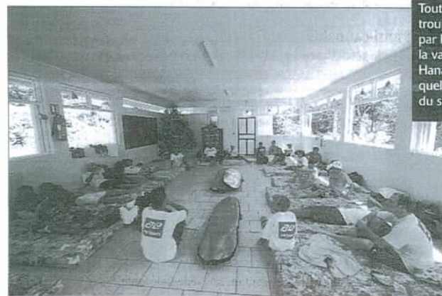
Toute la petite troupe a été logée par la paroisse de la vallée de Hanaïapa, juste à quelques mètres du spot de surf.