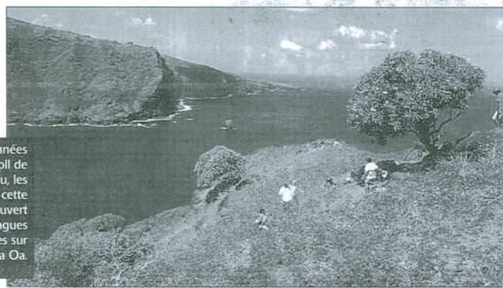
Après sept années sur l'atoll de Tikehau, les jeunes ont cette fois découvert les vagues marquisiennes sur l'île de Hiva Oa.